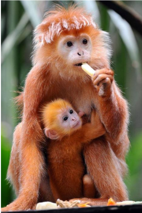
A MONKEY (manki – izgovorjava)