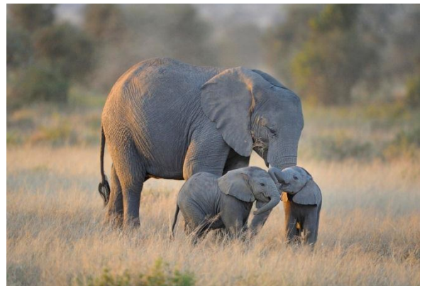
AN ELEPHANT – (elefant-izgovorjava)