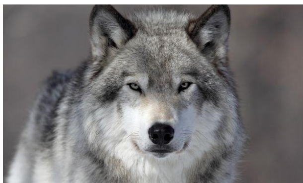
A WOLF (wulf – izgovorjava)