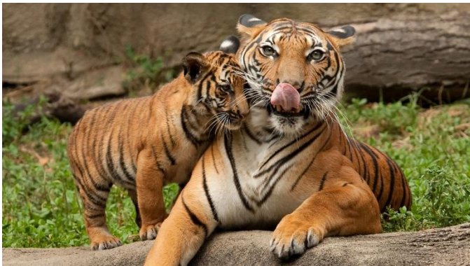
ATIGER (tajgr – izgovorjava)