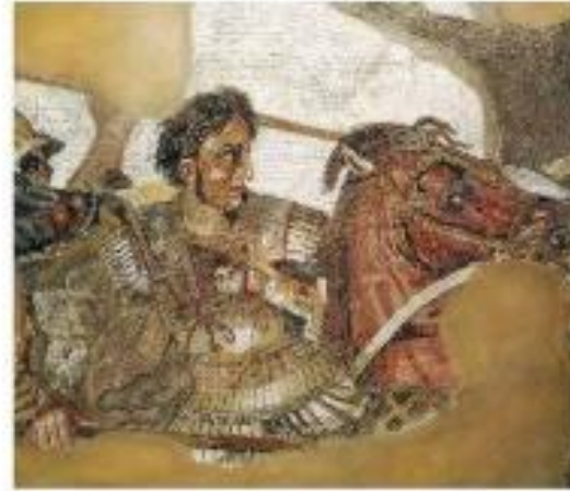
Aleksander Veliki med bitko pri Isu

Ustno pojasni, zakaj so vojaki kljub vsem naporom še vedno sledili Aleksandru.