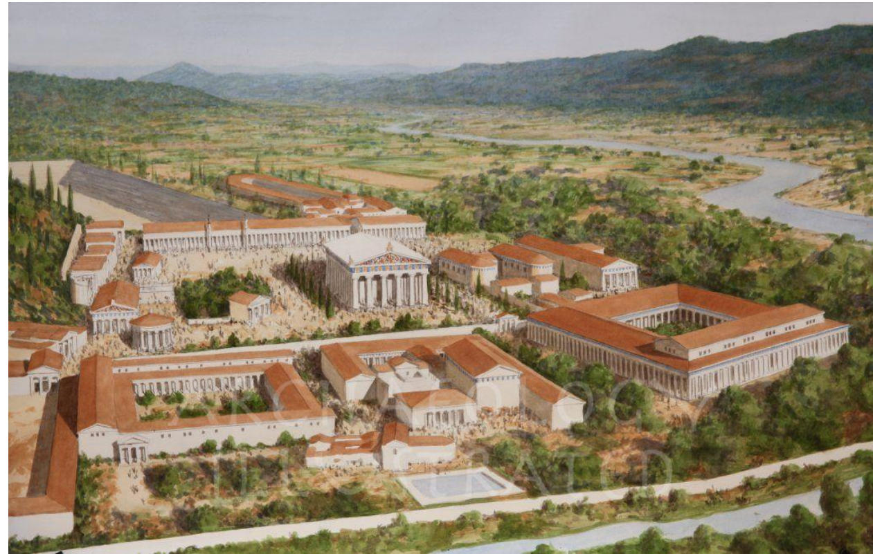
Rekonstrukcija prizorišča v Olimpiji

Olimpijske igre so potekale v mestu _____, ki leži na polotoku _____.