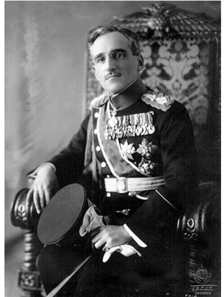
Kralj Aleksander Karađorđević