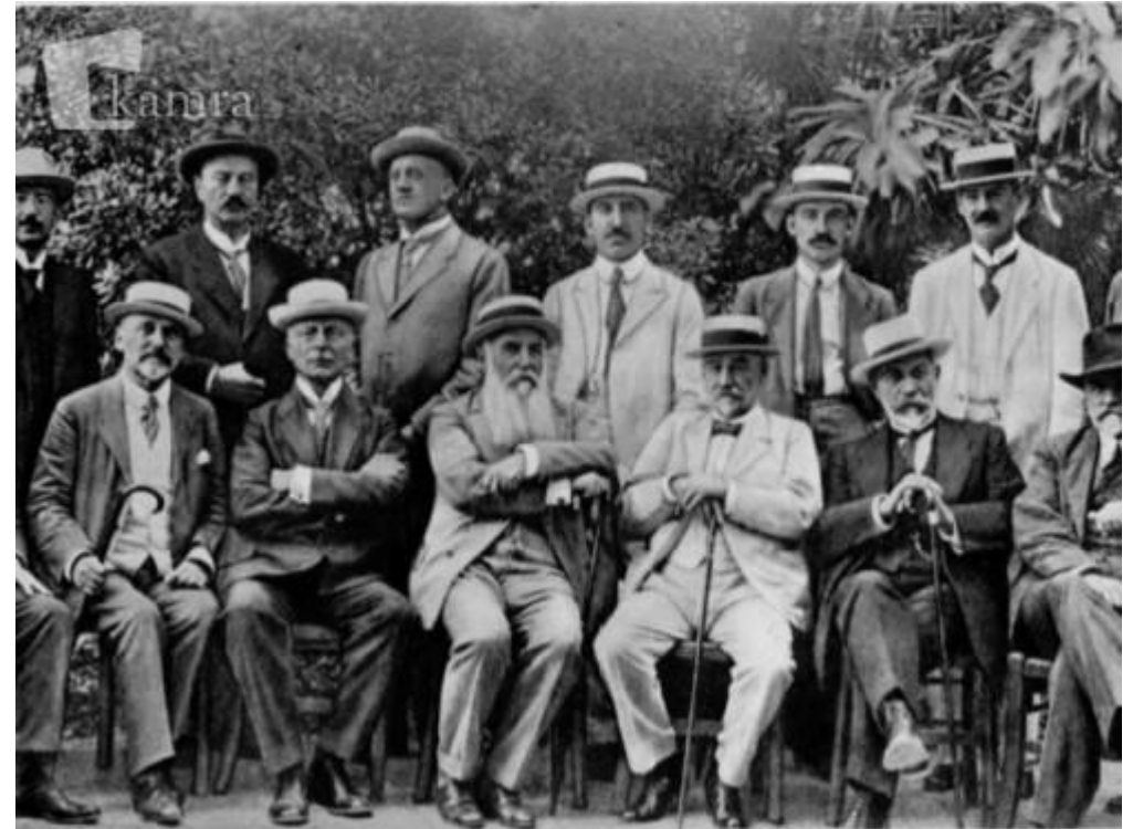
Jugoslovanski odbor na otoku Krk.