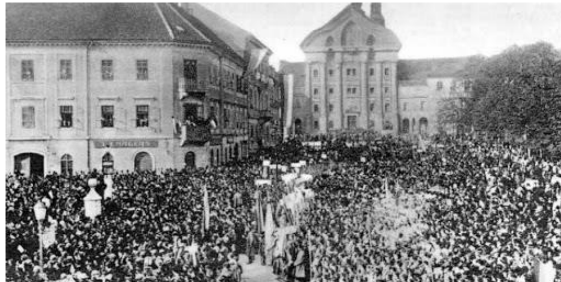
Razglasitev Države SHS na Kongresnem trgu v Ljubljani