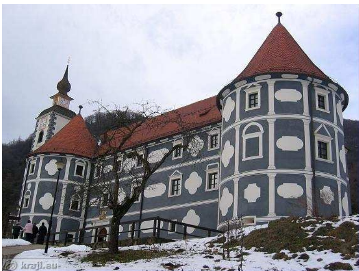
Samostan Olimje v Podčetrtku

Na nastanek posameznih krajev so vplivali različni dejavniki, kot so bližina rodovitne zemlje, vode, rudnega bogastva, trgovskih poti, cerkva, samostanov... Pri večjih krajih je bila zelo pomembna možnost obrambe, zato so iskali takšna področja, ki so bila že naravno zavarovana.