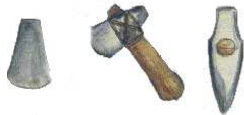
najdbe iz kamna

Nekoliko kasneje so na gričih začela nastajati utrjena naselja – gradišča. O obdobju iz prazgodovine nam pričajo številne najdbe iz kamna, gline, brona in železa.