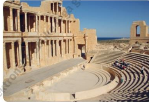
Rimsko gledališče, Sabratha, Libija