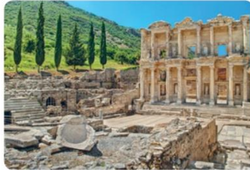
Rimska knjižnica, Efez, Turčija