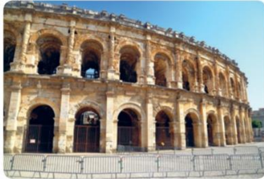
Rimski amfiteater, Nimes, Francija