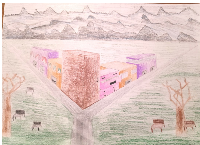
Rebeka, 9. B

2. V brskalniku odpri povezavo https://eucbeniki.sio.si/ . Poišči I-učbenik »LIKOVNA UMETNOST 9« ter KLIKNI NA SLIKO UČBENIKA , da se ti odpre njegova naslovnica.