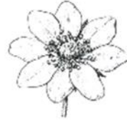
tretja rastlina Velesa