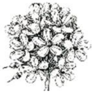
četrti rastlina Močvirski rožmarin