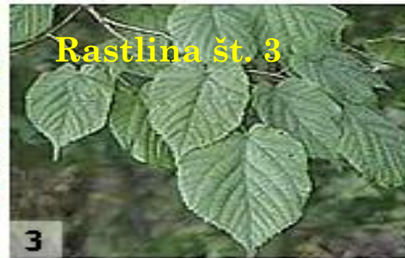
Rastlina št. 3