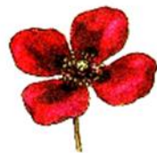
peta rastlina Mak