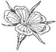
prva rastlina Kokalj