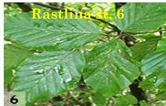
Rastlina št. 6