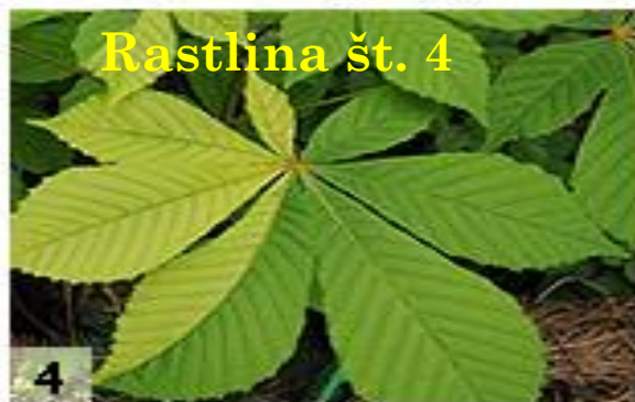
Rastlina št. 4