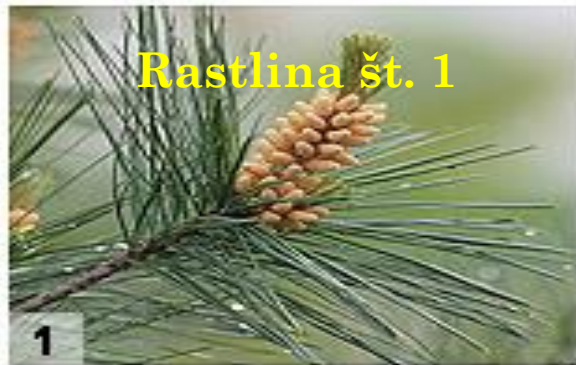
Rastlina št. 1