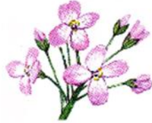
druga rastlina Travniška penuša