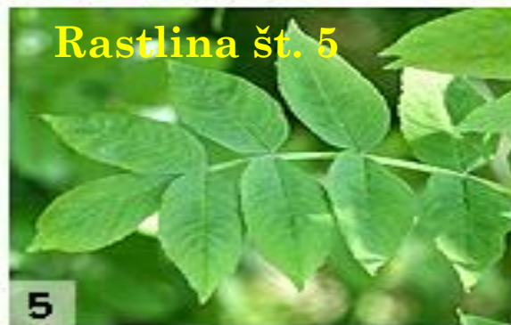
Rastlina št. 5