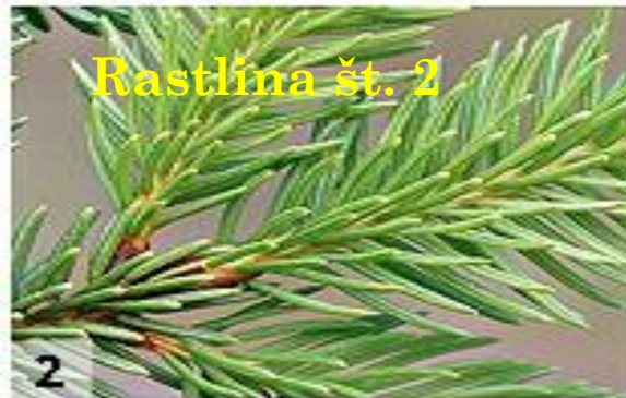
Rastlina št. 2