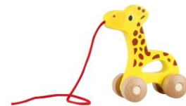
IGRAČKO Z VRVICO