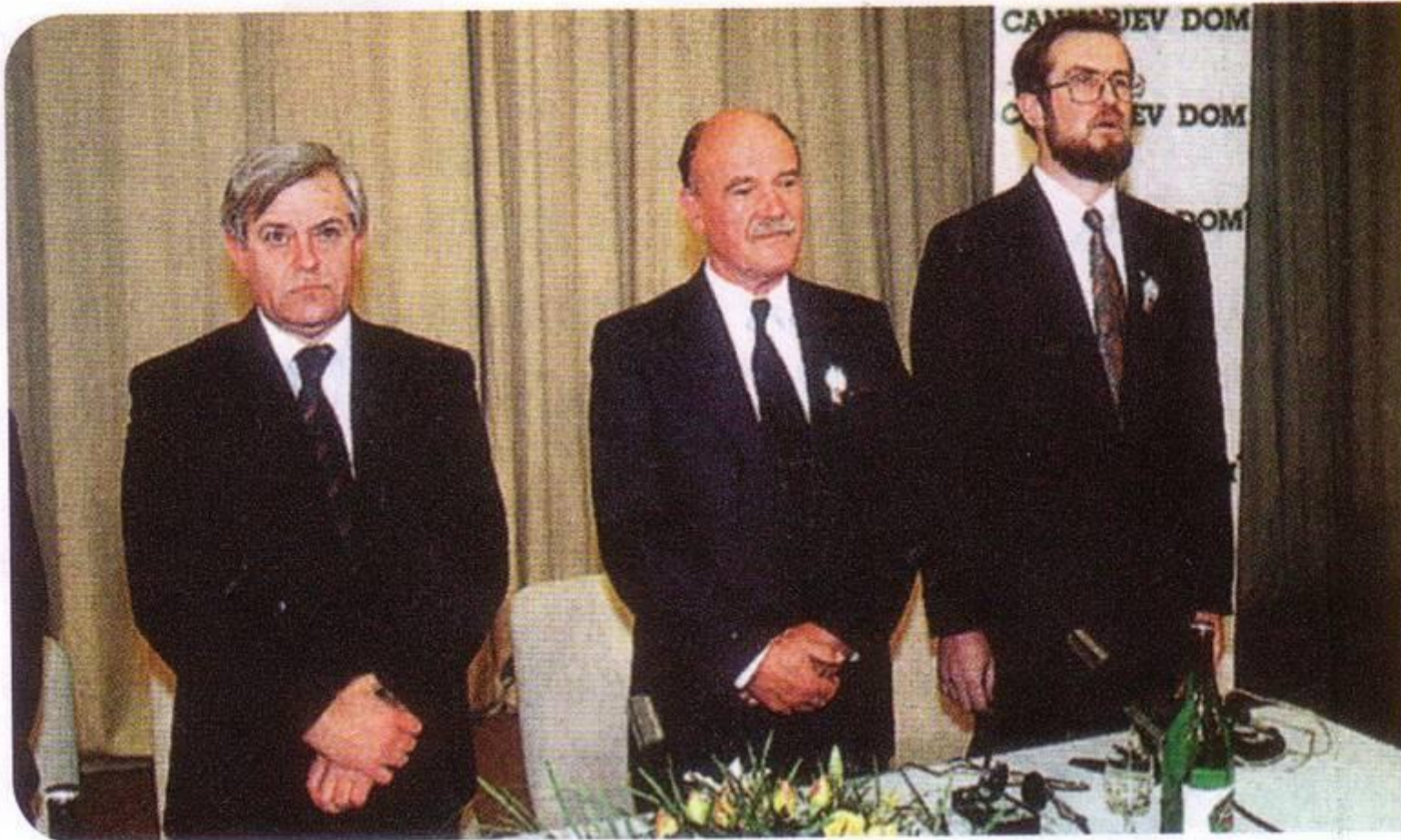
Trije predsedniki leta 1991. Predsednik predsedstva Republike Slovenije, Milan Kučan, predsednik skupščine, France Bučar, in predsednik vlade, Lojze Peterle.