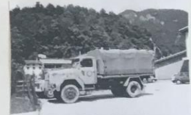
Zaplenjen kamion JLA z napisom na vratih TO pred Osnovno šolo v Kobaridu, 29.6.1991

Na Kolarškem: so bili 3 malobnijski prehodi: Robič, Livček, Most na nadiri