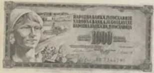
DINAR - Jugoslovanski denar

Nova stara domovina 23. decembar 1990 - večina Slovencev na glasovanju izvoli novo državo - Slovenijo