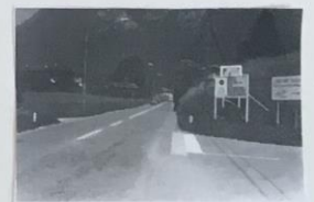
Jugoslovanska ljudska armada zapušta kobaridsko 25. 7. 1991

Dozvajanje je vodilo operativno poveljstvo Štaba TO Tolma, ki je bilo nastajalo v OS SIMONA GREGORČIČA. JLA se je vedela - brez iloveških rinter. JLA ji Kobaridlo razpustilo 25. junija