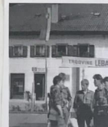
Posajena lipa in razvita nova Slovenska zastava Vojaki Teritorialne obrambe 27. junija 1991

Jugoslovanska ljudska armada "JLA" je slovenijo v tanki napredla in razvela vse mijske prehode v Republiho Italijo.