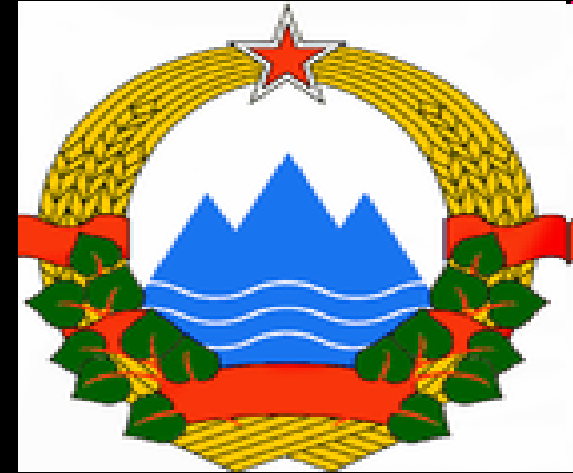
grb Republike Slovenije