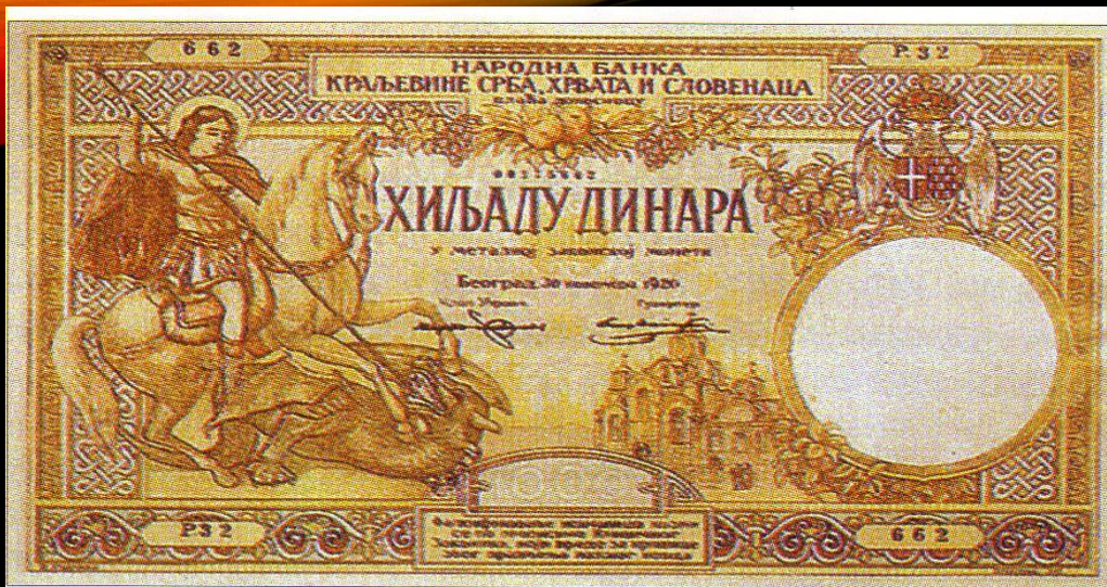
Bankovec Kraljevine Srbov, Hrvatov in Slovencev