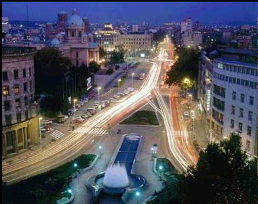
glavno mesto SFRJ: Beograd