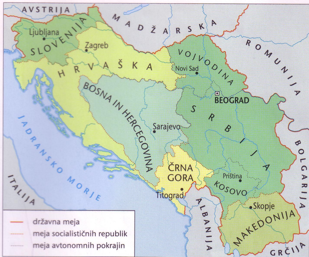
Razdelitev SFRJ na republike

LETA 1945 JE BILO KONEC DRUGE SVETOVNE VOJNE. SLOVENCJI, HRVATI, SRBI, ČRNOGORCI IN MAKEDONCI SO USTANOVILI SKUPNO DRŽAVO – SOCIALISTIČNA FEDERATIVNA REPUBLIKA JUGOSLAVIJA ( SFRJ ).