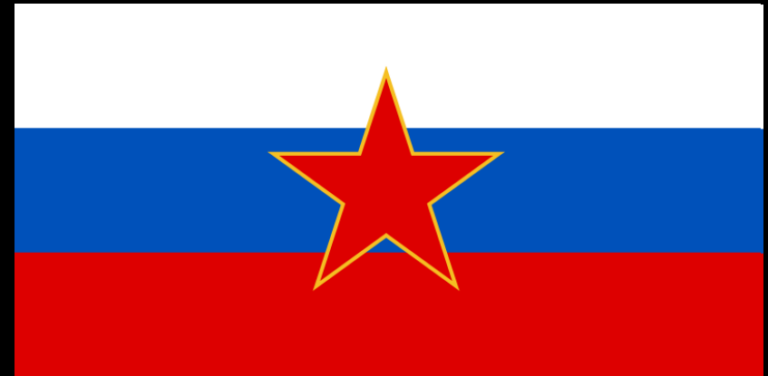
zastava Republike Slovenije