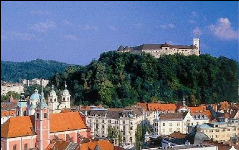
Glavno mesto: Ljubljana