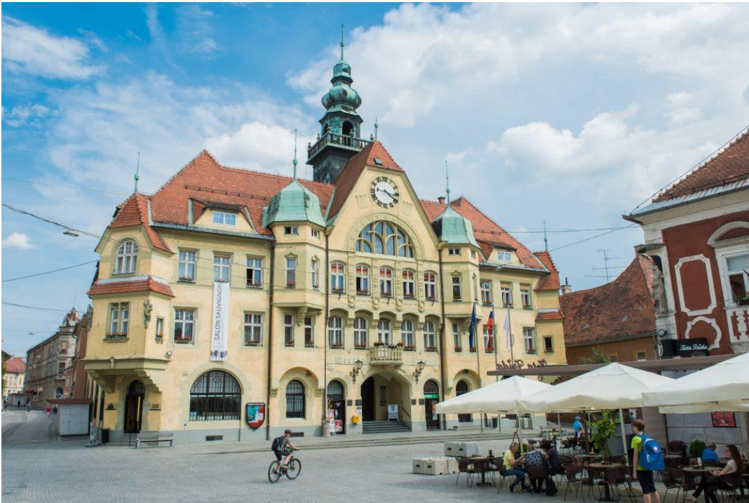
Mestna hiša na Ptuj

V srednjem veku ni bilo trgovin, kot jih poznamo danes, ampak so trgovci ob določenih dneh lahko na trgu prodajali svoje blago. Oglej si fotografije in s pomočjo učbenika zapiši glavne značilnosti mestnih trgov!