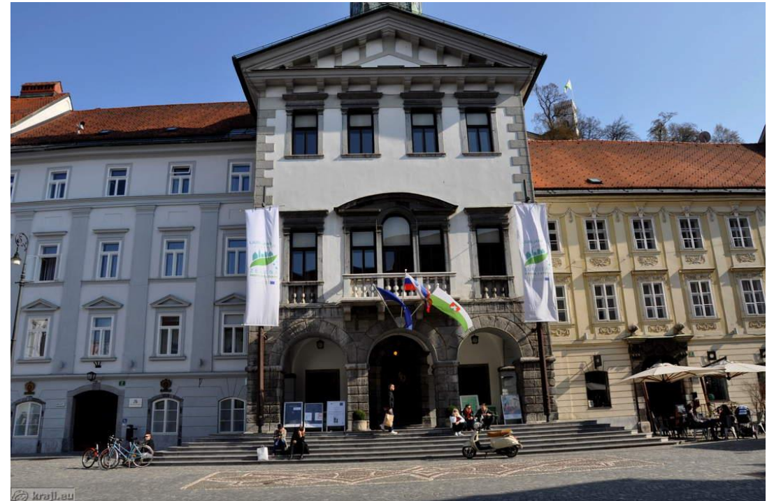
Mestna hiša – Magistrat v Ljubljani