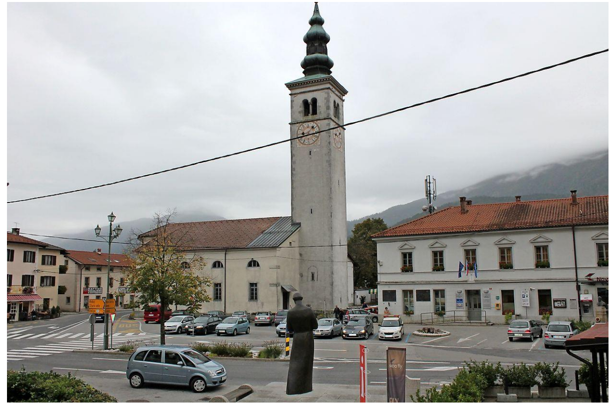
Tudi Kobarid je nastal kot trg ob križišču cest, ki pripeljejo iz Čedad, iz Bovca in iz Tolmina. V središču trga stoji cerkev Marijinega vnebovzetja.