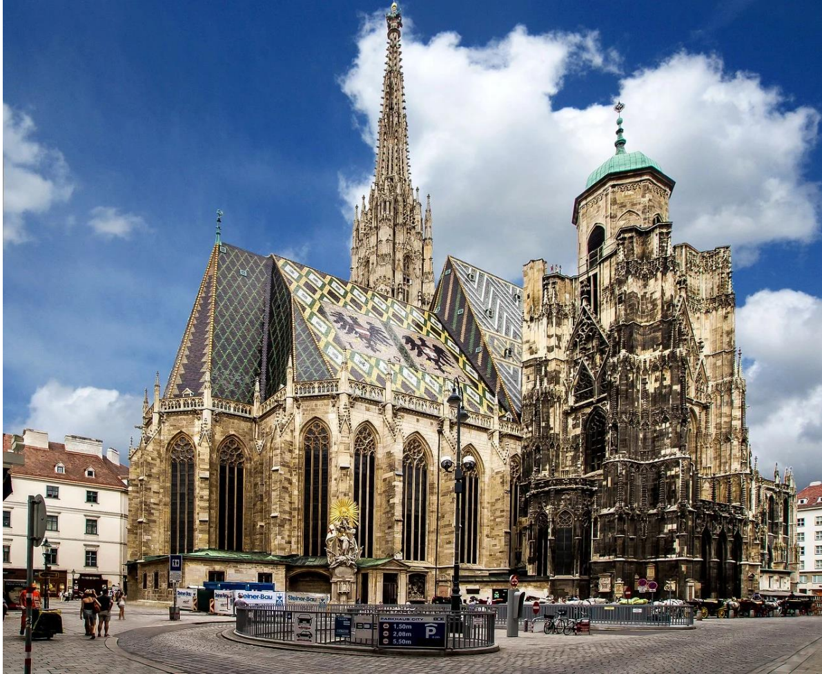
Stolnica Svetega Štefana na Dunaju stoji v središču mesta