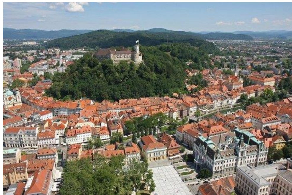
Ljubljana je nastala pod gradom